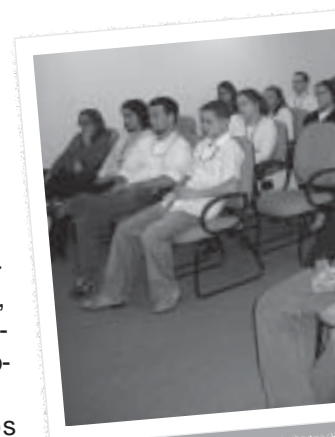
Funcionários do CRF