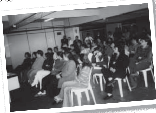
Funcionários do CREA acompanham debate

Como vários Conselhos e Ordens ainda não se pronunciaram sobre o debate destes temas, o SINSEXPRO vai reiterar a solicitação e agendar um encontro geral, para o qual serão convidados todos os companheiros da nossa base, de modo que os assuntos cheguem ao conhecimento dos funcionários. Confira como foram os debates já realizados: