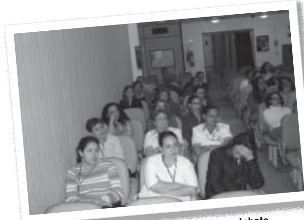
Funcionários do CRP acompanham debate

ço dos funcionários, inclusive de duas companheiras lotadas no interior do Estado. O Conselho, que foi o primeiro a ser afetado pelos pareceres do TCU sobre contratação de pessoal sem concurso, pôde agora debater o assunto com a experiência de ter revertidos