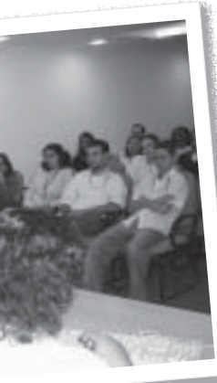
ate no CRFarmácia

rias, mas os companheiros do CRTR obtiveram muitos e importantes esclarecimentos, tanto sobre a Reforma Sindical - da qual não tinham ouvido falar - quanto sobre a questão das contratações sem concurso. Este último tema ocupou a maior parte da conversa e levou os funcionários a identificarem suas fragilidades e como o SINSEXPRO pode contribuir para revertê-las.