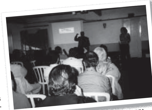
O diretor Percival fala durante seminário no CREA

expediente e na sua própria sede. Outras, entretanto, adotaram postura arrogante e negaram aos seus funcionários a oportunidade do debate, embora essas direções tenham aberto espaço nas suas agendas, sem criar maiores dificuldades, para debater