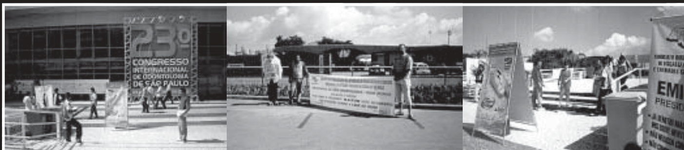
As cartas foram distribuídas em todos os acessos do Anhembi, onde ocorreu o Congresso

a remuneração do funcionário, que é diretor do Sindicato, sob a alegação de que o Acordo assinado em 2003 tenha perdido a validade. Vale lembrar que o Sindicato esgotou todas as possibilidades de diálogo com esta autarquia antes de partir para os protestos. Durante o ano de 2004, foram diversas as tentativas de negociação, porém, sem qualquer sucesso devido