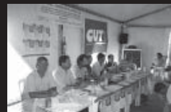
Convidados da oficina no Fórum Social Mundial

Oficina da FENASERA reúne respostas para as maiores preocupações dos trabalhadores