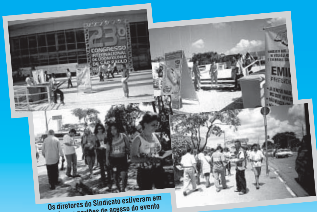
Os diretores do Sindicato estiveram em todos os portões de acesso do evento

A manifestação ocorreu no dia 23/01, durante a realização do 23º Congresso Internacional de Odontologia organizado pela Associação Paulista de Cirurgiões Dentistas - APCD, no Anhembi. Foram distribuídas cerca de 15 mil cartas abertas aos participantes do evento.