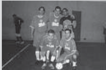
OAB - Time A