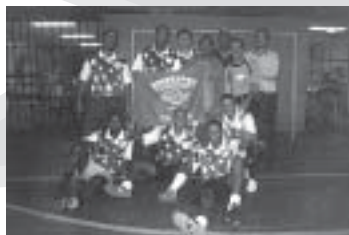
OAB - Time B