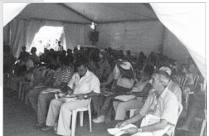
A oficina foi acompanhada por companheiros de diversos sindicatos e de Conselhos/Ordens