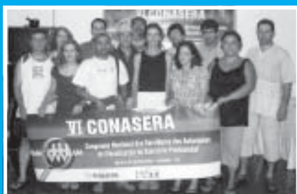
Diretores do SINSEXPRO durante o VI CONASERA